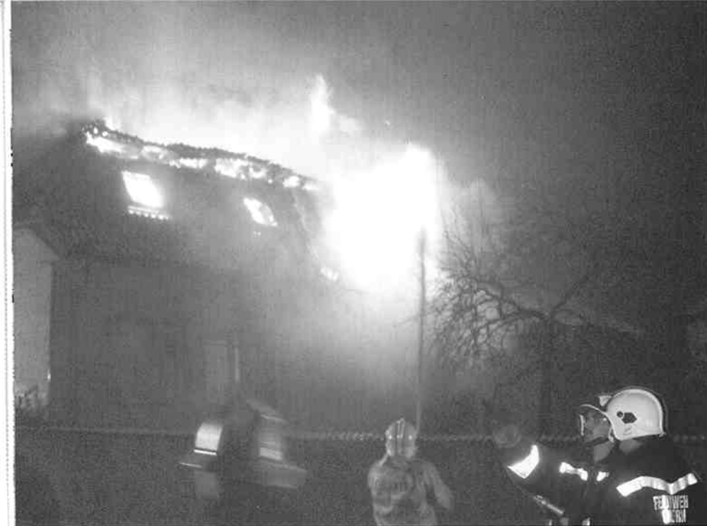
Ein Einfamilienhaus wurde schwer beschädigt