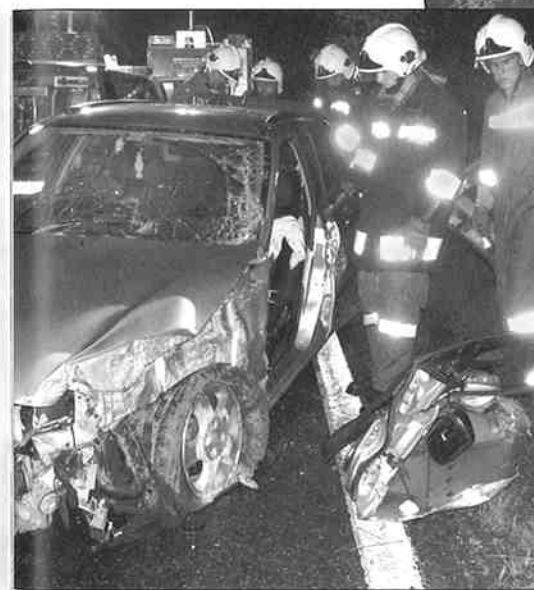
Das blieb vom Unfallauto übrig

Ebenfalls zu einem Menschenrettungseinsatz, der als normale Fahrzeugbergung alarmiert wurde, kamen wir im August. Ein junger ehemaliger Feuerwehrmann unserer Feuerwehr fuhr aus ungeklärten Gründen beim Sandbunker gegen eine Betonmauer. Der eingeklemmte Mann wurde von uns befreit und mit der Rettung ins Krankenhaus Tulln gebracht. Glücklicherweise konnte er schon nach einigen Tagen entlassen werden.