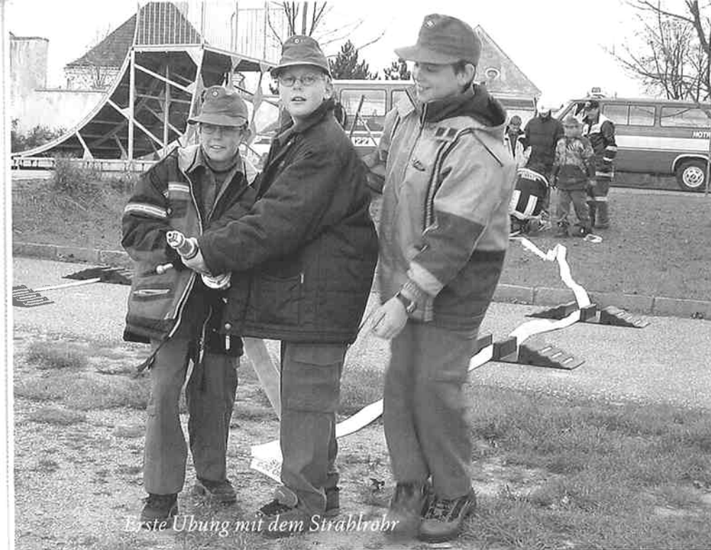
Erste Übung mit dem Strahlrohr