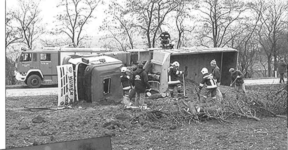
Feuerwehren Ollern und Ried im Einsatz

Vermutlich überhöhte Geschwindigkeit brachte einen mit Erde beladenen Sattelschlepper ausgangs einer Kurve am Flachberg zum Kippen. Seitlich rutschend streifte er mit dem Kabinendach einen im Straßengraben stehenden Birnbaum, riss diesen mit dem Kippaufbau um und ein Teil der geladenen Erde stürzte ins Feld. Unter großem Aufwand ist es uns gelungen, das tonnenschwere Fahrzeug mittels Seilwinde wieder auf die Räder zu ziehen.